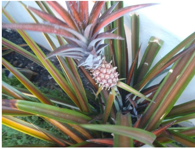
الاناناس فى كل مكان فى هونولولو وبييرل هاربر والى اللقاء فى ذكريات اخرى من مدينة اخرى